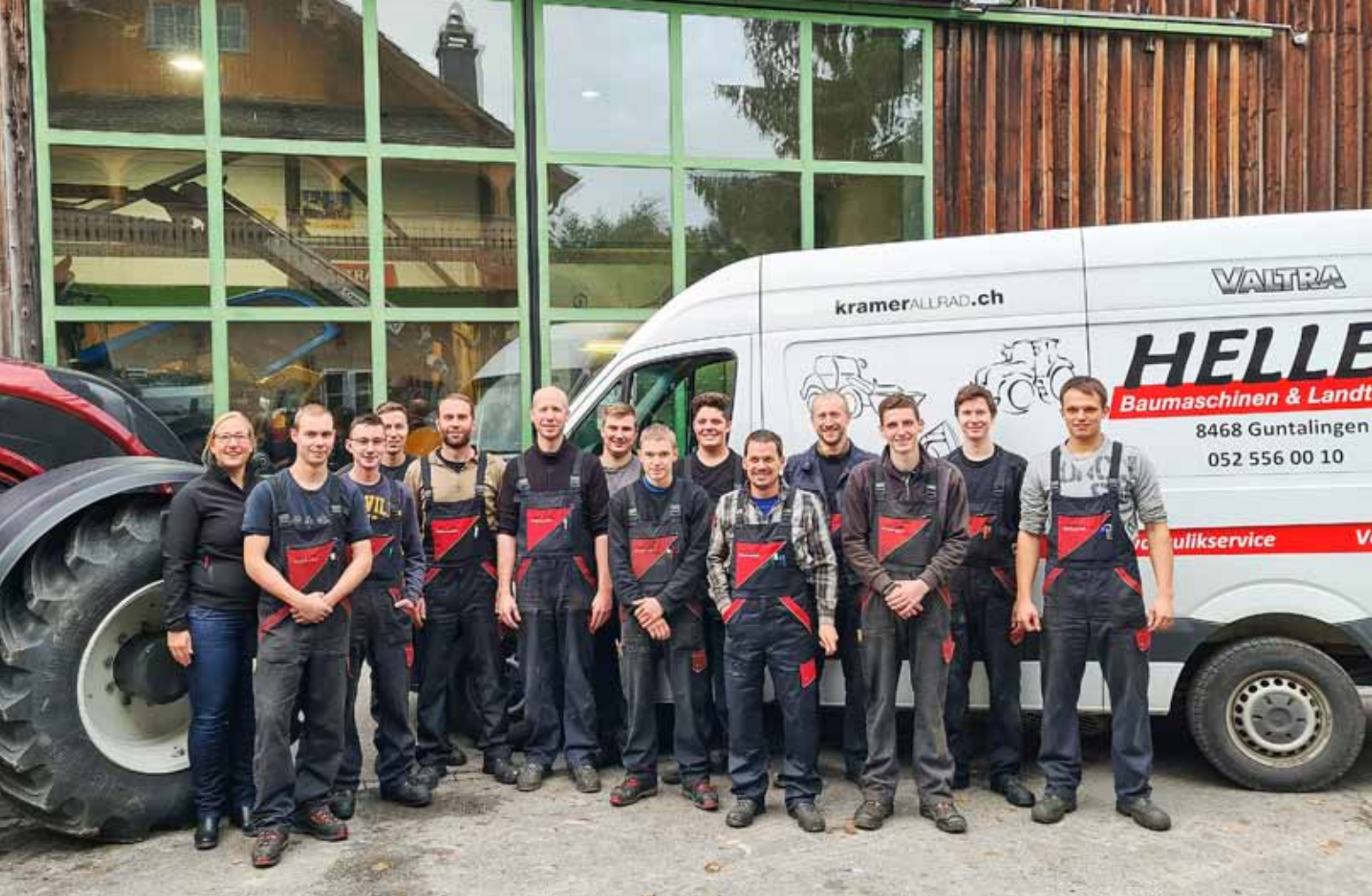
Das Team der Heller Baumaschinen und Landtechnik GmbH: Wenn alle hinter einer Marke stehen.