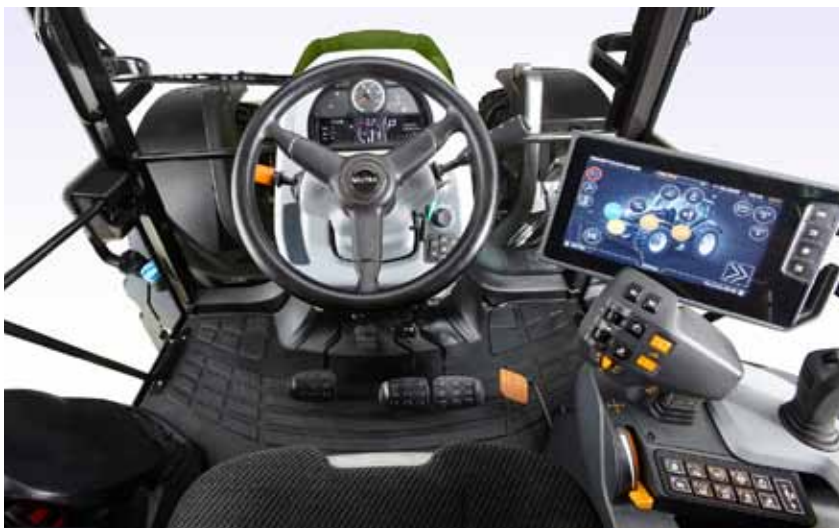
Gehen, Sehen, Fahren. Die neue G-Serie ist extrem einfach kennen zu lernen und in Betrieb zu nehmen. Der Zugang zur geräumigen Kabine ist einfach. Und die einfach zu bedienenden Bedienelemente sind ergonomisch angeordnet.

Die G-Serie eignet sich dank ihrer Vielseitigkeit auch optimal für kommunale Aufgaben und den Straßunterhalt. Für den Frontanbaubereich sind ein leistungsstarker Frontkraftheber