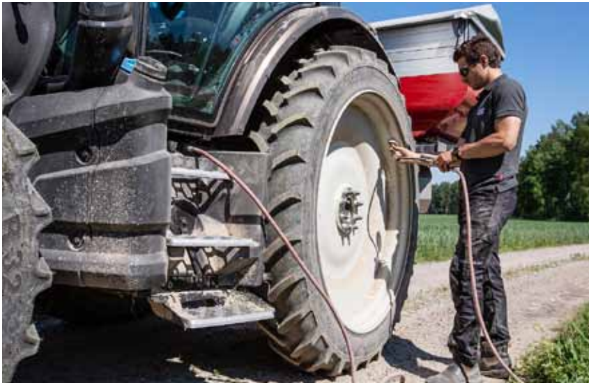
Die neue G-Serie ist mit einem seitlichen Druckluftanschluss beim Kabinenaufgang lieferbar, so dass z. B. der Reifendruck leicht eingestellt werden kann.

mit einer Hubkraft von 3 t und eine Frontzapfwelle erhältlich.