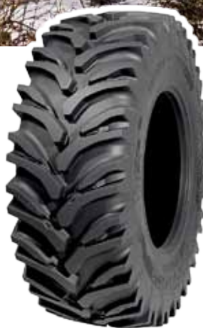
Nokian Traktor King.

Der Nokian Tractor King ist der Robuste für Forst- und Baustelleneinsatz. Der revolutionäre Aufbau von Innenstruktur und Seitenwand sorgt für erstklassigen Pannenschutz. Hoher Fülldruck ermöglicht hohe Tragfähigkeit. Breite Lauffläche und spürbar erhöhte Anzahl von Traktionskanten sorgen für erstklassige