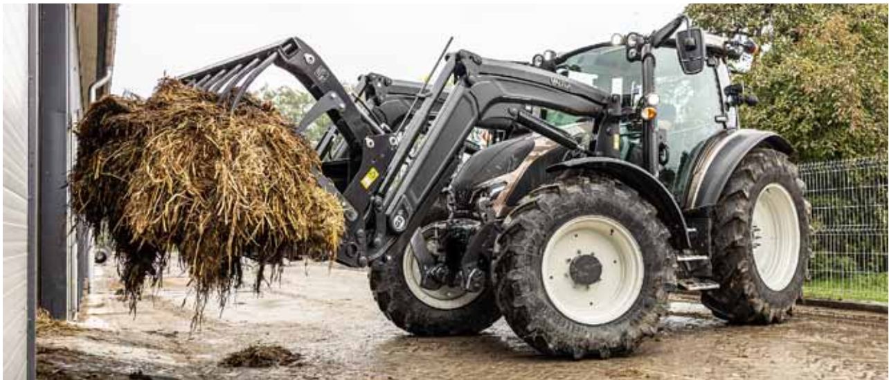
Die G-Serie wiegt 5.140 kg. Das geringe Gewicht, die kompakte Größe und die agilen Leistungen machen sie ideal für landwirtschaftliche Aufgaben. Das maximale Gesamtgewicht beträgt 9.500 kg.