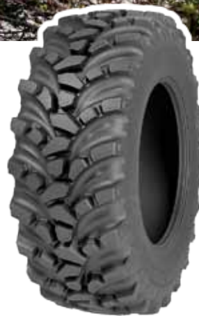
Nokian Ground King.

Traktion. Das innovative Laufflächendesign mit gleichmäßigem Bodenkontakt sorgt für eine komfortable und kosteneffiziente Laufleistung.