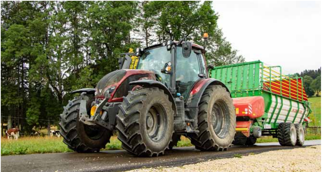
Valtra N174 Direct : Ideal für den Transport wie auch für Mäharbeiten für die Mäharbeiten.

ten ohne das Erntegut zu überfahren, bevor es geschnitten wird. Die Einrichtung wird von den Amstutzs umso mehr geschätzt, seit die Firma Krone ein 4,04 m breites Mähwerk anbietet, welches für die jurassischen Verhältnisse perfekt geeignet ist, sich jedoch aufgrund seiner Dimensionen nur am Heck anhängen lässt. Diese perfekte Kombination ermöglicht Marc Amstutz, Hauptfahrer des Traktors, auf der Strasse mit maximaler Sicherheit und Übersicht die Maschine zu transportieren und auf dem Feld deutlich schneller zu wenden und effizienter zu arbeiten.